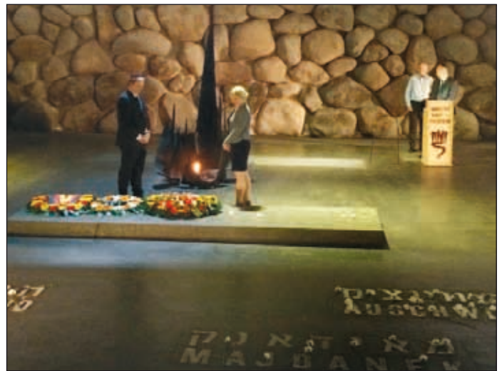
Kranzniederlegung in der Halle der Erinnerung in Yad Vashem

Das Wissen um die Vergangenheit ist daher auch eine verbindliche Verpflichtung für alle Demokraten, insbesondere aber für uns Rechtsanwälte, ihre Stimme gegen jegliche Ansätze und Formen von Ausgrenzung, Verfolgung und Fremdenfeindlich-